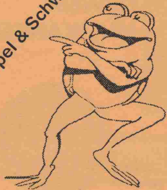
Foto-Drogerie Schmitt Offenbacher Landstraße 9 63500 Seligenstadt-Froschhausen Tel. (0 61 82) 99 05 93 Fax (0 61 82) 99 05 94